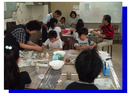
昨年の講座の様子