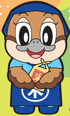
大阪府広報担当 副知事もずやん