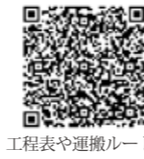
工程表や運搬ルート