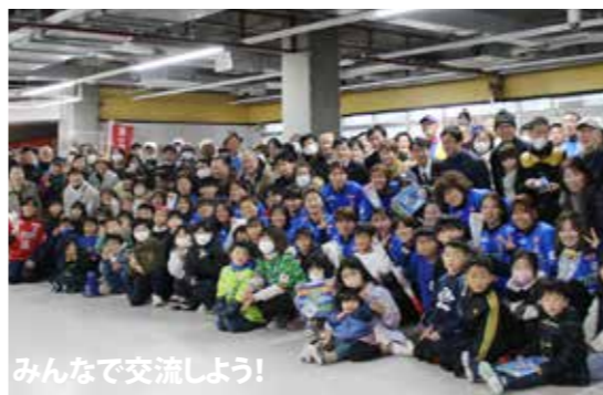
みんなで交流しよう！

※大人は申し込み不要です。どなたでも参加可能ですので、選手と子どもたちとの交流の様子をぜひご覧ください！