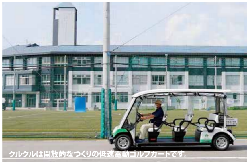
クルクルは開放的なつくりの低速電動ゴルフカートです。

現在、クルクルは毎週月・木曜日にオンデマンド運行を行っています。みなさんどれくらいの方が、利用されていると思いますか? 右横のグラフを見ると、4月から徐々に利用者が増えていることが読み取れます。昨年度、最も利用者が多かった10月の利用者は、なんと244人! また、夏場の暑い時期に利用が多く、冬場の寒い時期は、少し利用が減る傾向にあるようです。次回は、利用目的のデータなどを掲載予定です。お楽しみに!