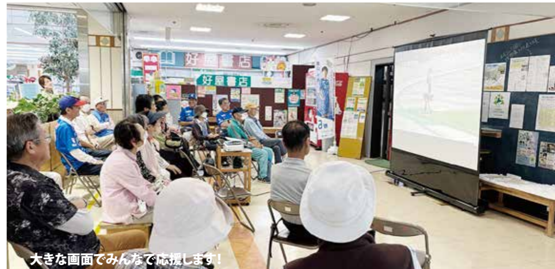
大きな画面でみんなで応援します!

スペランツァ大阪の試合を大きな画面に投影し、地域のみなさんで応援できる場を設けます! 「女子サッカーってどんな感じのかな?」と気になっている方、「みんなで試合を見るの楽しそう!」という方は、是非お越しください! 日程はコノテラ通信でお知らせします! 無料で、予約等も不要ですので、お誘い合わせの上、お気軽にご参加ください!