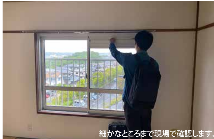
細かなところまで現場で確認します。