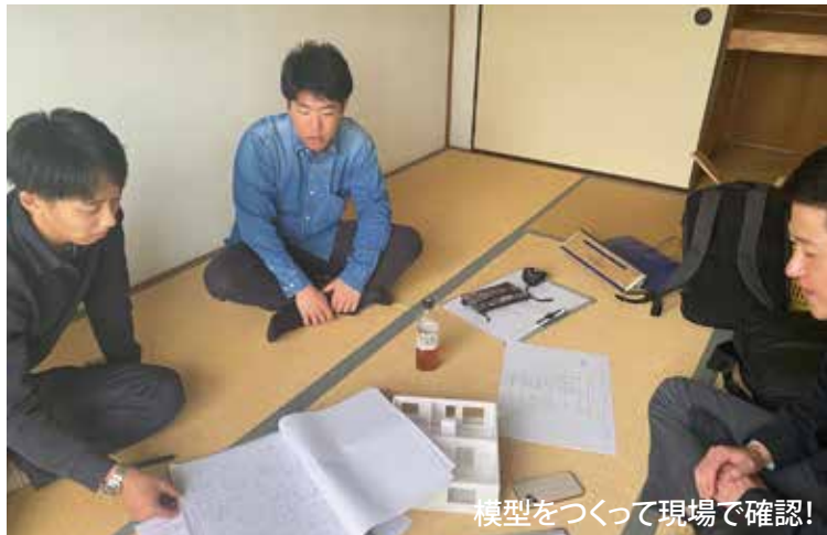
模型をつくって現場で確認！

5月前半には、ある程度、提案が固まってきたこともあり、参加している地域の方々と一緒に進捗確認する機会を設けて意見交換を行いました！丸々2時間みっちり活発な意見交換が行われ、「 改めて住宅が、そこで暮らすひとり1人にとっての思いのこもった「暮らしの器」なのだ と感じる時間でした。(学生談)」来月号では、改修現場の様子をお伝えできる予定です。お楽しみに！