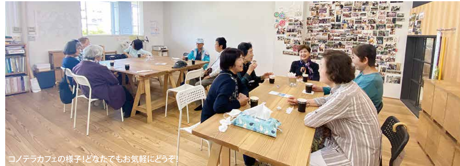
コノテラカフェの様子！どなたでもお気軽にどうぞ！

生活応援「お互いさん」とコノミヤテラスとのコラボ企画として、5月から始まったコノテラカフェですが、 大変好評で、毎回20名近い方にお立ち寄りいただいています。 どなたでもお気軽にお越しください！