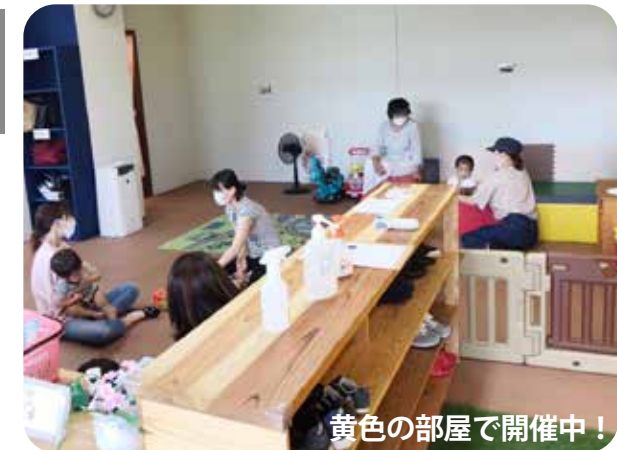
黄色の部屋で開催中！

これまで、コロナ禍での運営ということで、人数制限を設けて、実施していたふれあいテラスですが、 6月開催分から人数制限を解除します！お子さんと気軽にお越しください！