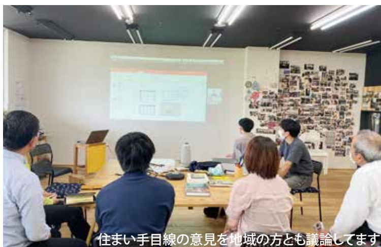
住まい手目線の意見を地域の方とも議論しています。