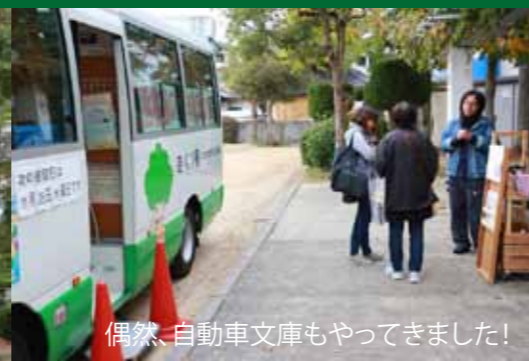
偶然、自動車文庫もやってきました！