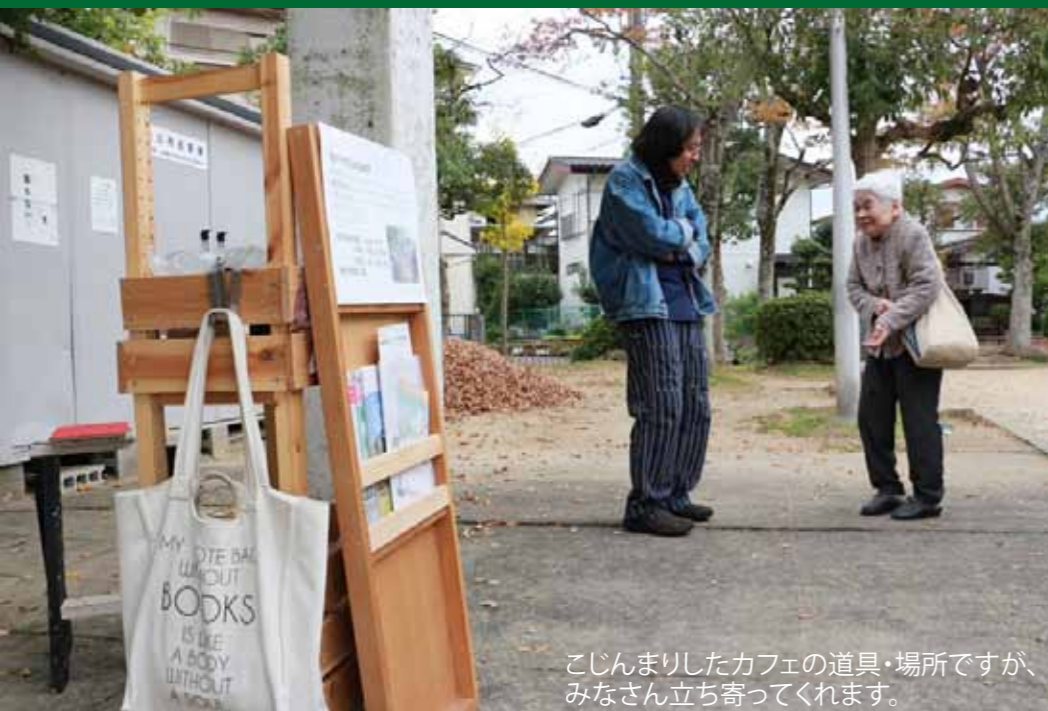
こじんまりしたカフェの道具・場所ですが、みなさん立ち寄ってくれます。