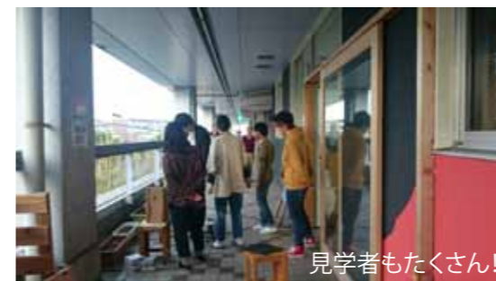
見学者もたくさん！

ものづくりを通して多世代の人をつなぐ、ものづくりのチカラを地域に役立てていくことを目的に、まずは活動しよう！ということで、毎週木曜木工部をスタートしました。現在、学生とテラスにやってくる子供たちと一緒に、ベンチをつくったりしています。絶賛仲間募集中ですので、木曜日ぜひお越しください！