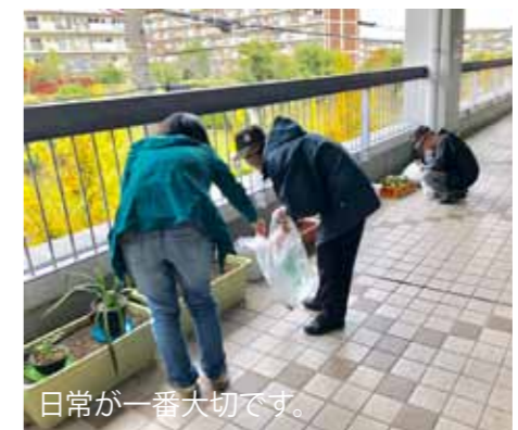
日常が一番大切です。

ある日、ラジオ体操の常連さんが、「外の廊下は冬になったら寂しいなあ」とお花を植えてくれました。いろいろお話ししていると、夏の朝顔やゴーヤの成長が楽しめだったとのこと。確かに夏に植物がある時は、それがきっかけとなり、会話が生まれていました。ちょっとしたことなのですが、コノミヤテラスの外廊下をもっと楽しくしていきたいなと思います！