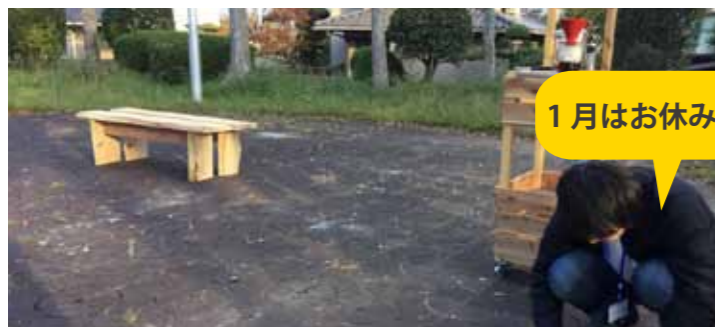
1月はお休みします！