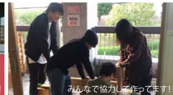
みんなで協力して作っています！