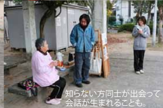
知らない方向士が会って、会話が生まれることも。