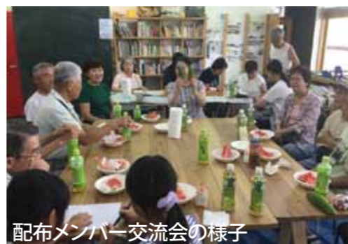
配布メンバー交流会の様子