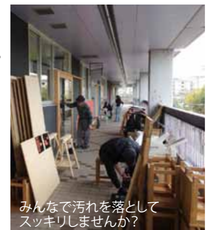
みんなで汚れを落としてスッキリしませんか？