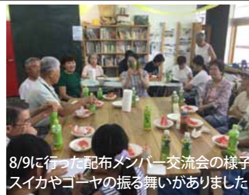
8/9に行った配布メンバー交流会の様子 スイカやゴーヤの振る舞いがありました!