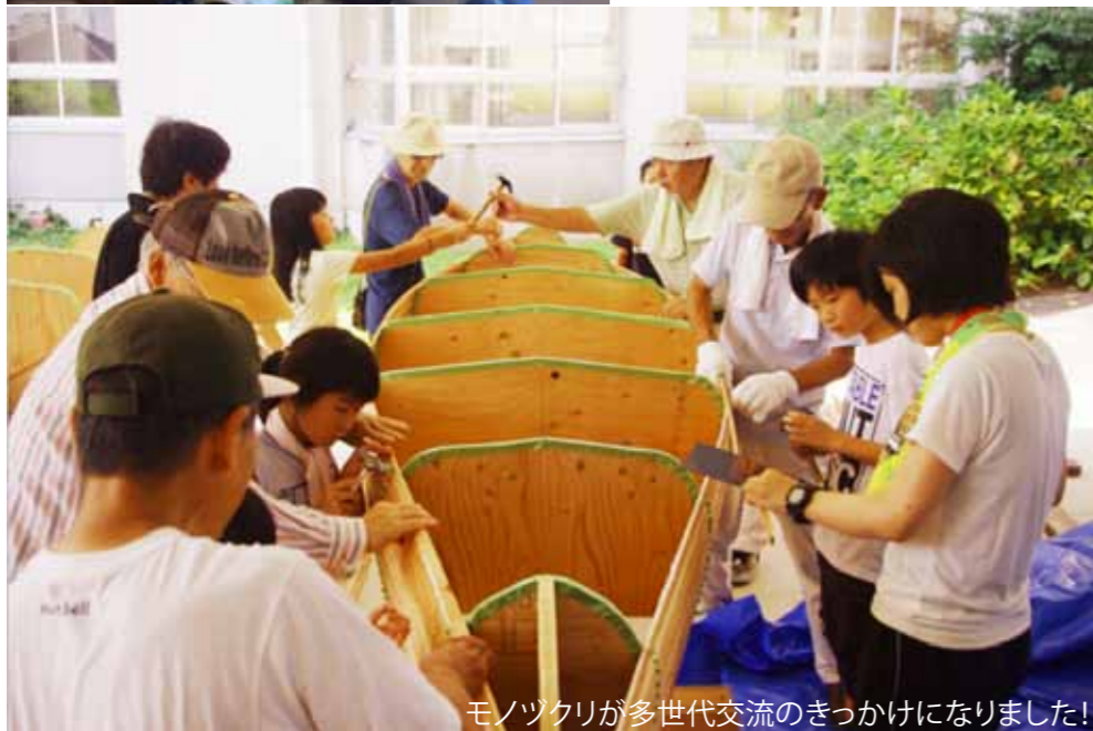
モノツクリが多世代交流のきっかけになりました!

コノテラ通信の配布メンバーを募集しています! お手伝いして下さる方はコノミヤテラスまでお声がけください!年に数回メンバー交流会を開催します!