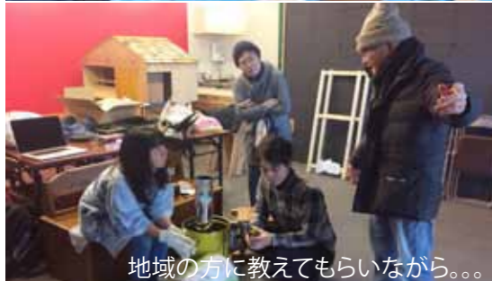
地域の方に教えてもらいながら。。