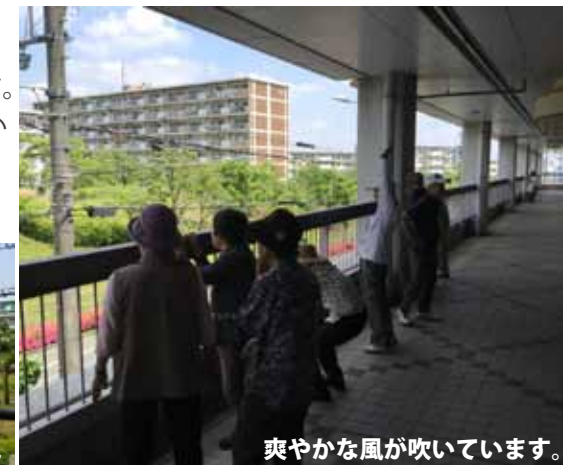
爽やかな風が吹いています。