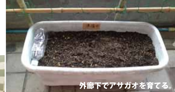
外廊下でアサガオを育てる。