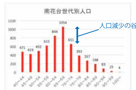
図1: 南花台における世代別人口グラフ

南花台には平成28年4月2日現在南花小学校区 総人口8076名(男性3824名、女性4252名)が住んでおられます。どこかで見たようなグラフ(図1)ですが、日本の人口分布と全く同じです。この南花台にあります。そして、60歳代をピークに人口減少が顕著になっております。世代別人口グラフ(図2)でもお分かりのように70歳以降に健康に気を付けなければいけないかがはつきり出ております。予防医学的には70歳からでは遅く、もっと早くから健康に意識した生活が求められますね。 6月から29年度咲く南花台健康クラブの新規モニター募集を開始します。コノテラ通信6月号でお示しましたが、モニターになれるのも圧倒的に女性が多く、男性はどうしても健康より仕事で過ごしてきた習慣があるのではないのでしょうか? 平均寿命ではなく、健康寿命を考えてみてはいかがでしょうか? とりわけ、第一次定年を迎えられた方は、めでたく還暦を迎えられたのを機に健康を意識してみませんか。健康サポーターM