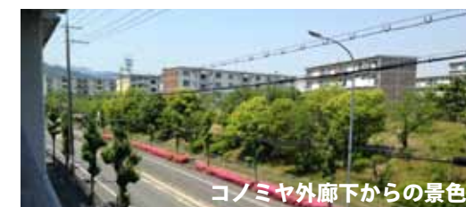
コノミヤ外廊下からの景色

5月から外廊下でラジオ体操をしています。爽やかな風を感じながらのラジオ体操はいいですね。ラジオ体操は毎朝10:00から、誰でも参加できます。