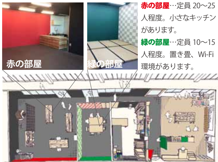
コノミヤテラスの内部

赤の部屋 …定員 20~25人程度。小さなキッチンがあります。 緑の部屋 …定員 10~15人程度。置き畳、Wi-Fi環境があります。