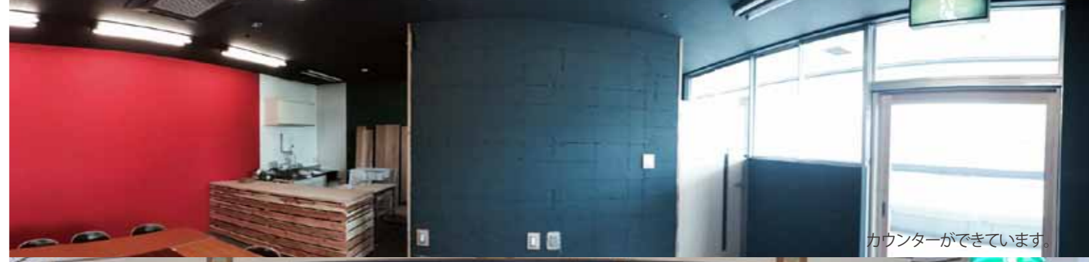
カウンターができています。