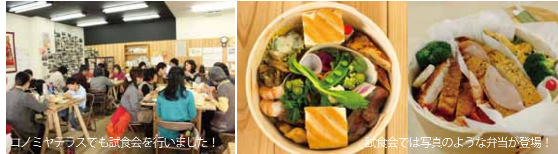
コノミヤテラスでも試食会を行いました！

2/21(火)・3/5(土)に咲っくピクニック健康弁当試食会が行われ、両日ともにたくさんの方にご参加いただきました！いただいた意見をうけて下記の日程で完成したピクニック健康弁当を実際に食べる会が開催されます！