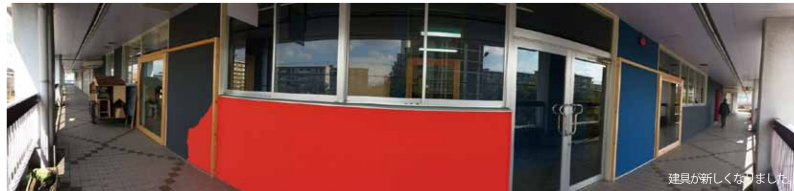
建具が新しくなりました。