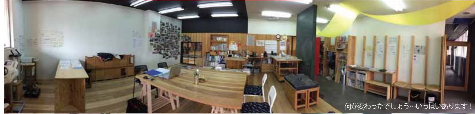
何が変わったでしょう…いっぱいあります！