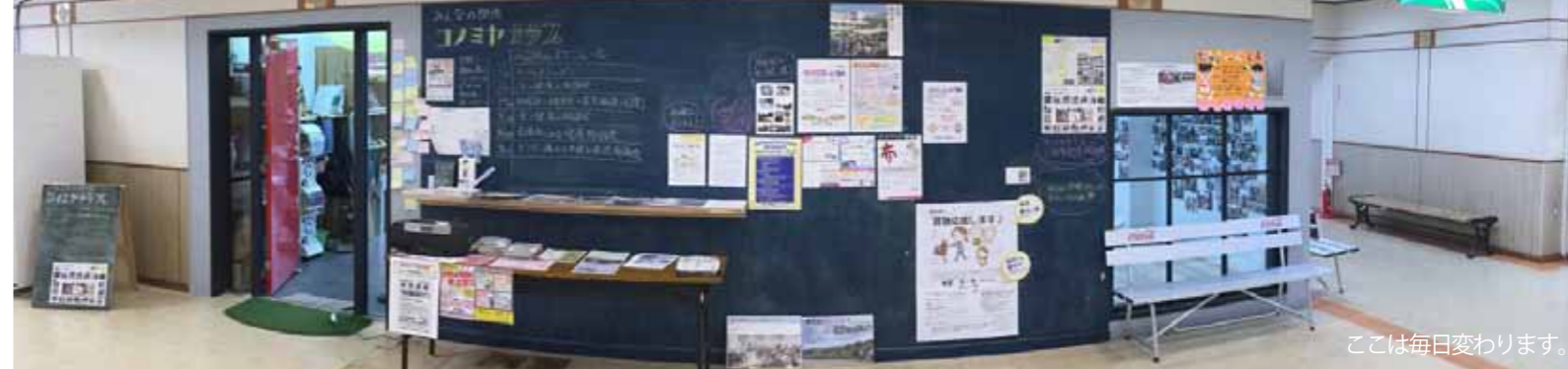
ここは毎日変わります。