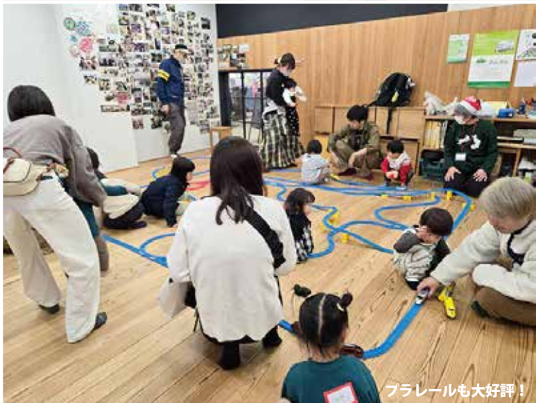
ブラレールも大好評！