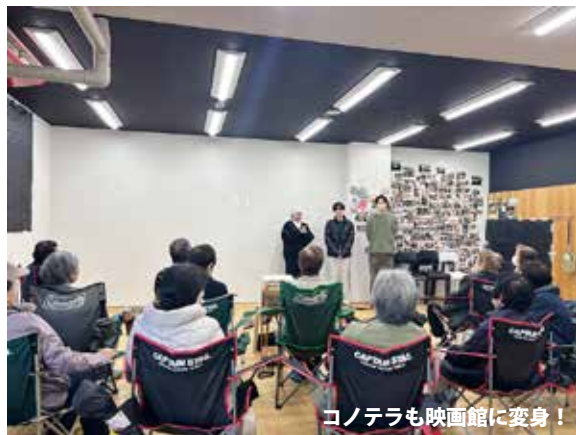
コノテラも映画館に変身！

12/7（日）に関西大学映画研究部による自主制作映画の上映会を実施しました！当日は 5本の短編映画をオムニバス形式で上映し、20名の方がご参加されました 。大学生たちの瑞々しい作品たちを観て、学生に対して、「懐かしい気持ちになった」「一所懸命こんな活動しているのはいいこと」とあたたかい言葉をいただき、学生も「学外の方々に観てもらって反応をもらえるのが新鮮で、またやりたい」と刺激を受けたようでした！