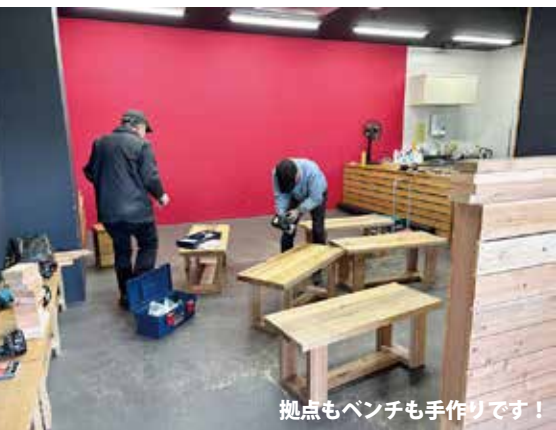
拠点もベンチも手作りです！