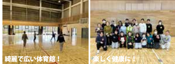
綺麗で広い体育館！