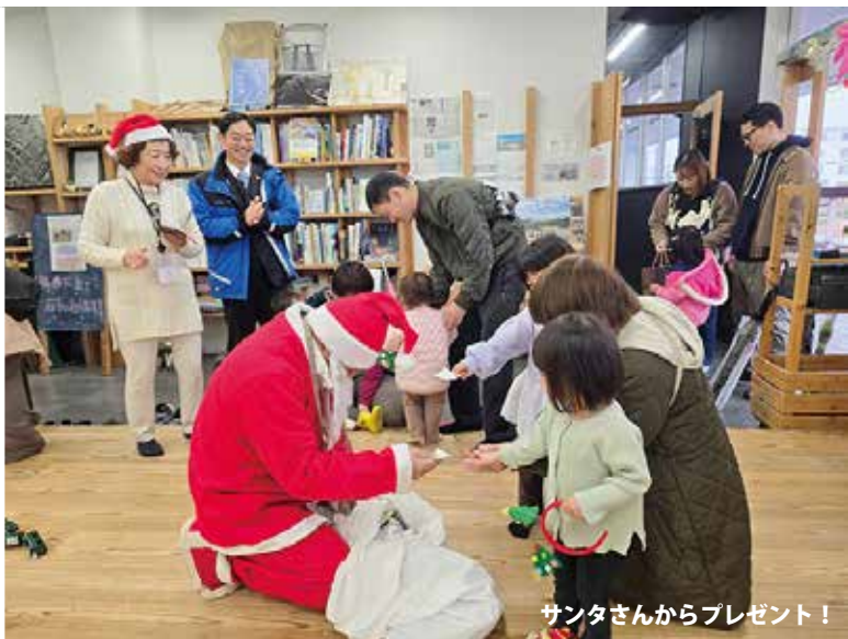
サンタさんからプレゼント！