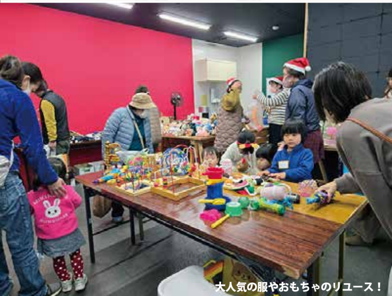
大人気の服やおもちゃのリユース！