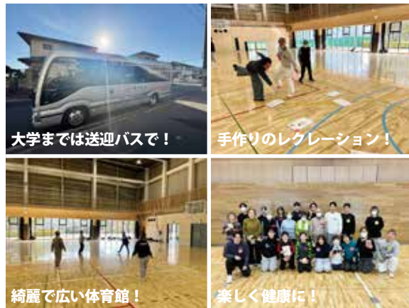
大学までは送迎バスで！