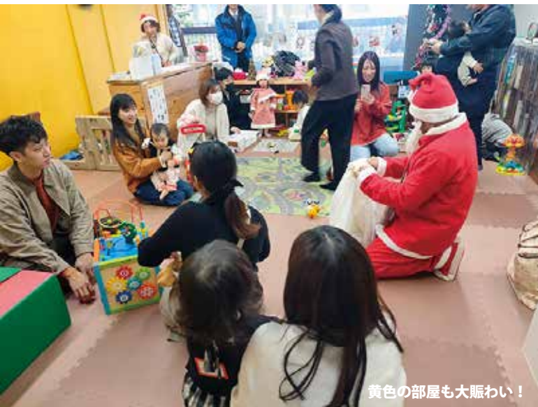
黄色の部屋也大賑わい！