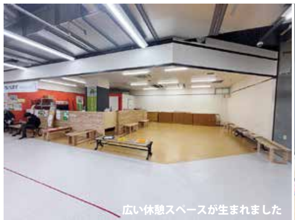
広い休憩スペースが生まれました