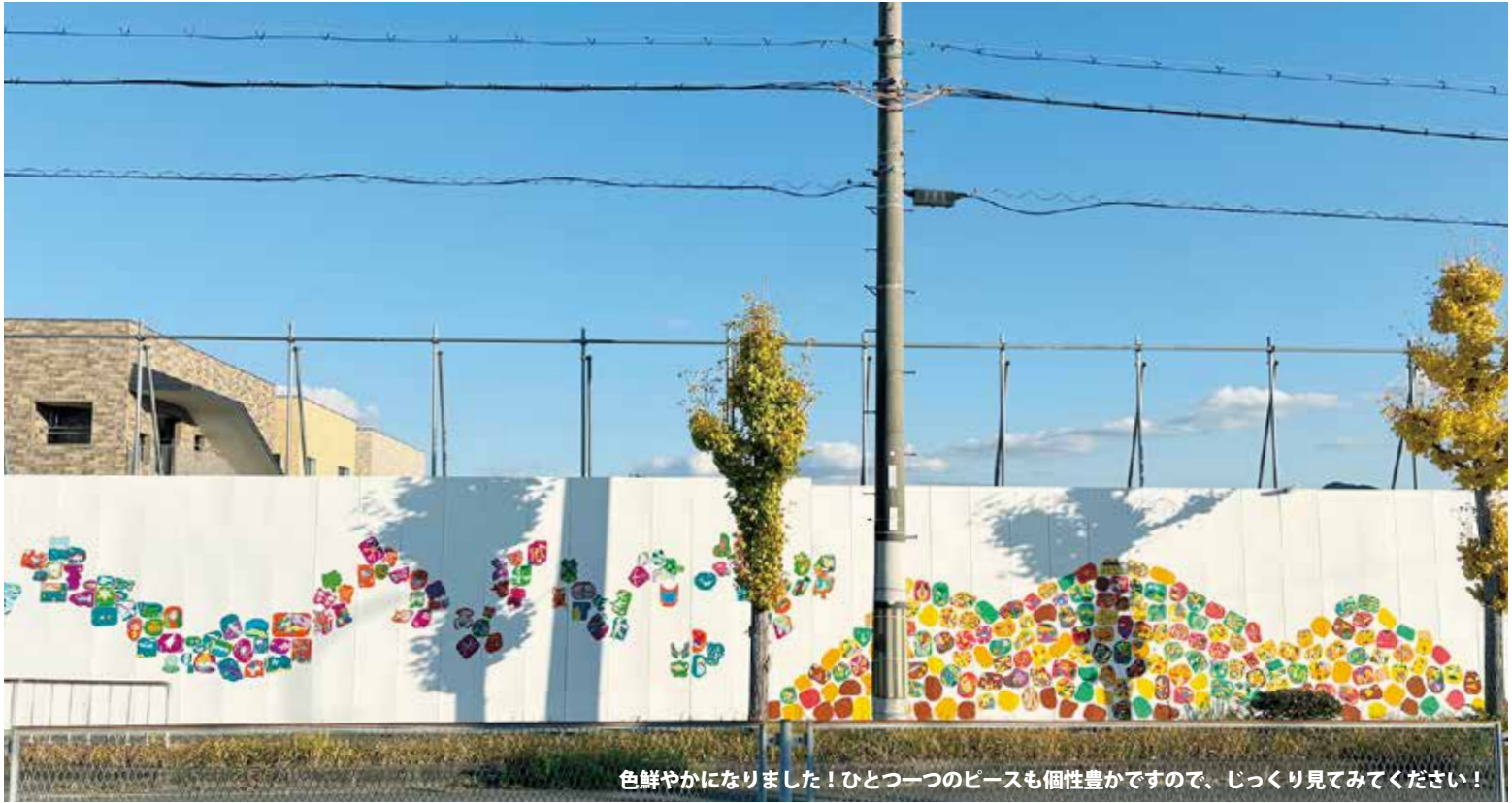
色鮮やかになりました！ひとつ一つのピースも個性豊かですので、じっくり見てみてください！