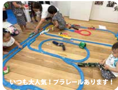
いつも大人気！プラレールあります！

こどもたちのためのクリスマス会 を開催します！コノテラ全体を使って プラレール を走らせたり、いろんな遊びスペース、服や絵本のリユース、 サンタさんも来るかも！？参加費無料 ですので気軽にご参加ください！