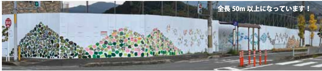
全長 50m 以上になっています！