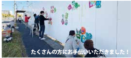
たくさんの方にお手伝いいただきました！

11/16（日）に、地域の皆さんが制作したアートピースの貼り込み作業を行いました！今回は「秋の山」と「南花台中学校の中学生がつくった鳥・魚・蝶をモチーフにしたピース」を貼っています。紅葉で山並みや街も色づきと相まって「綺麗になったなあ」と嬉しいお声をいただいています。冬場は糊の定着が悪いので、しばらく作業はお休みになりますが暖くなる頃には・・・？仮囲いまだまだ変わり続けます！