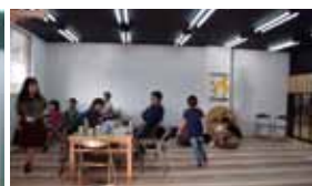
木の部屋はオープンスペース。占有的な活動はできません。