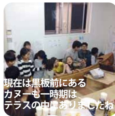
現在は黒板前にあるカヌーも一時期はテラスの中にもありましたね