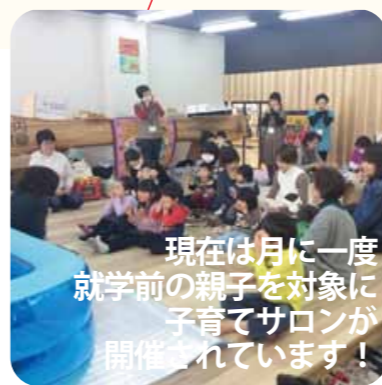
現在は月に一度就学前の親子を対象に子育てサロンが開催されています！