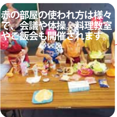
赤の部屋の使い方は様々で、会議や体操、料理教室やご飯会も開催されます。