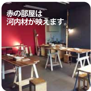
赤の部屋は河内材が映えます。