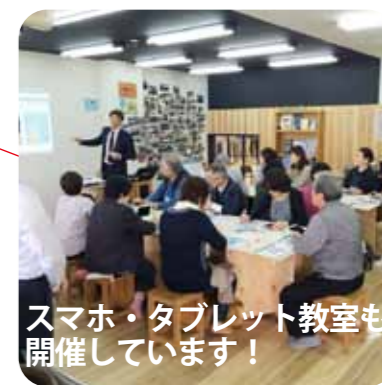
スマホ・タブレット教室も開催しています！