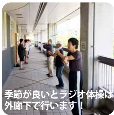
季節が良いとラジオ体操は外廊下で行います！