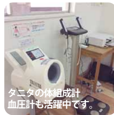
タニタの体組成計 血圧計も活躍中です。