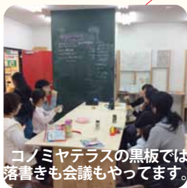
コノミヤテラスの黒板では落書きも会議もやっています。