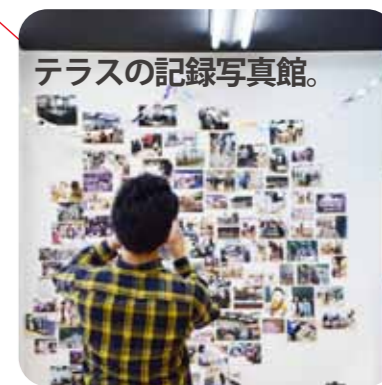
テラスの記録写真館。