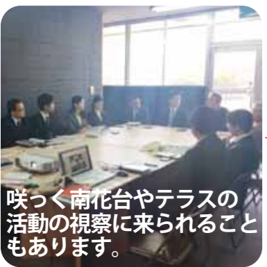
咲く南花台やテラスの活動の視察に来られることもあります。