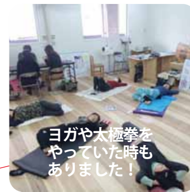
ヨガや太極拳をやっていた時もありました！