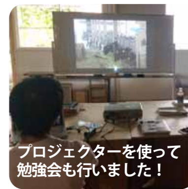
プロジェクターを使って勉強会も行いました！