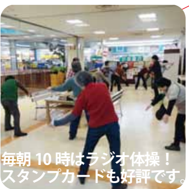
毎朝10時はラジオ体操！スタンプカードも好評です。