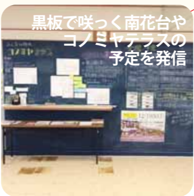
黒板で咲く南花台やコノミヤテラスの予定を発信