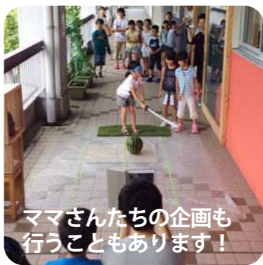
ママさんたちの企画も行うこともあります！