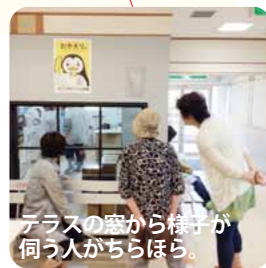
テラスの窓から様子が伺う人がちらほら。