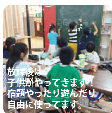
放課後は子供がやってきます！宿題やったり遊んだり自由に使ってます。