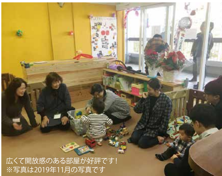
広くて開放感のある部屋が好評です! ※写真は2019年11月の写真です