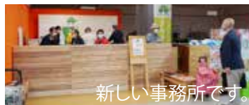
新しい事務所です。

運行日 毎週月曜日 予約受付時間 9:15 ~ 11:30 運行時間 9:30 ~ 12:00 利用予約方法