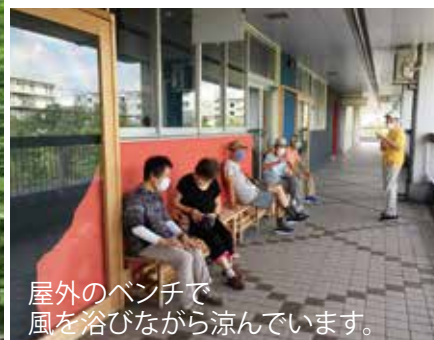
屋外のベンチで風を浴びながら涼んでいます。