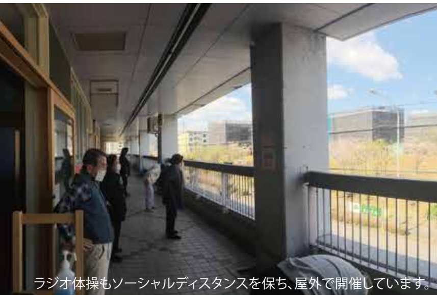
ラジオ体操もソーシャルディスタンスを保ち、屋外で開催しています。