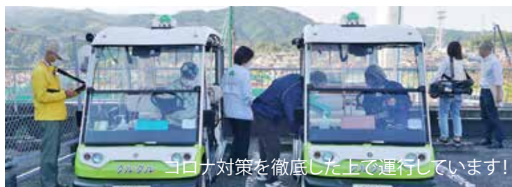
コロナ対策を徹底した上で運行しています！

電話 (0721-62-5123) もしくは事務所 (コノミヤ南花台店1階) での対面受付 ※当面の間スマホアプリでの予約受付は休止