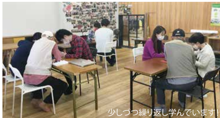
少しずつ繰り返し学んでいます！